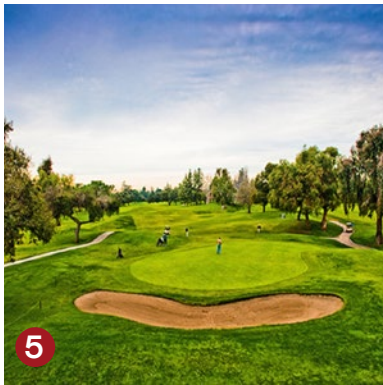
1. 阿凯迪亞公園 2. 聖塔安妮塔跑馬場 3. 洛杉磯縣植物園 4. Westfield聖安娜塔購物中心 5. 聖安娜塔高爾夫球場