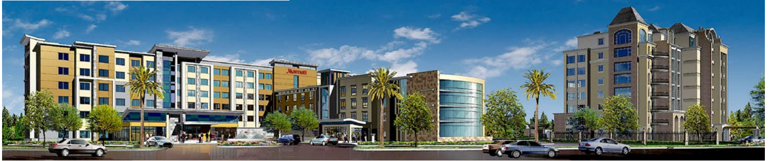
萬豪酒店3D建築示意圖